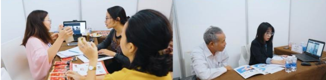
Hình ảnh minh họa sự kiện kết nối giao thương ENTECH Vietnam 2021